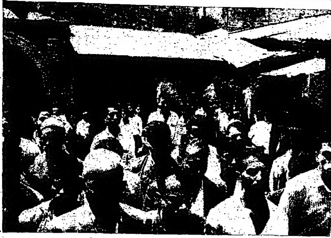
صورة مميزة للجوهرة المصممة الصليبية خلال المظاهرة الضخمة التي نظمها أهل القدس في ٥ حزيران وفرتها الشرطة الإسرائيلية بالقوة